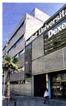
El hospital USP en

■ El mayor grupo de hospitales privados de España, USP Hospitales, cerró el primer semestre con un beneficio bruto de 21 millones de euros, un 2,3% más. El incremento de la facturación fue de un 2%, hasta los 167 millones. En Barcelona USP cuenta con el Institut Universitari Dexeus. / Barcelona